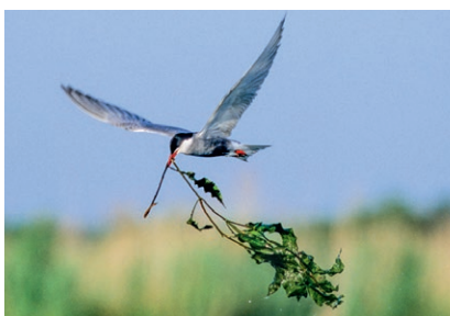
Guifette moustac sur l'étang de la Sous

> Les différents types d'affûts : affûts fixes, affûts mobiles, affûts enterrés, affûts « cage » (dans les arbres), affûts depuis un véhicule. Choix des téléobjectifs : démonstration avec 500 mm f/4, trépieds, monopodes et rotules (Wimberley, Novoflex et Gitzo). Cours sur les techniques d'affût pratiquées selon les espèces : mammifères ou oiseaux.