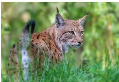
Lynx de la Réserve de la Haute-Touche