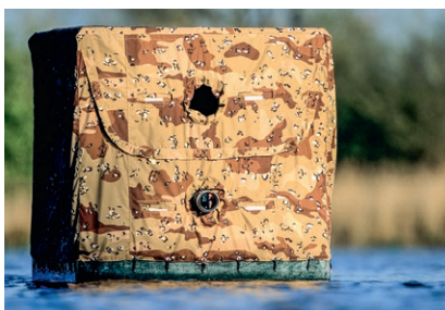
Séance d'affût flottant sur un étang privé

Départ en direction d'un étang privé pour découvrir l'affût flottant conçu par Gilles Martin.