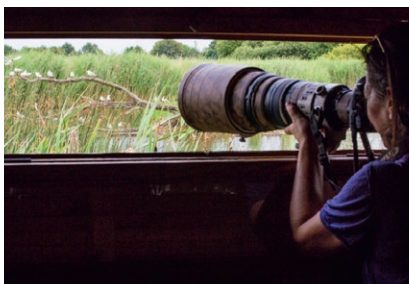
Affût sur l'étang de la Sous

Rendez-vous à l'Auberge « Les 2 pierres » : 8, place de l'église - 36800 Migné Téléphone : 02 54 38 39 89