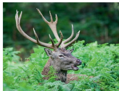
Cerf de la Réserve de la Haute-Touche

Départ pour la réserve de la Haute-Touche. Le plus vaste parc animalier de France dirigé par le Muséum national d'Histoire naturelle de Paris, qui poursuit de nombreux programmes de reproduction d'espèces menacées.