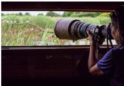
Affût sur l'étang de la Sous

Rendez-vous à l'Auberge « Les 2 pierres » : 8, place de l'église - 36800 Migné Téléphone : 02 54 38 39 89