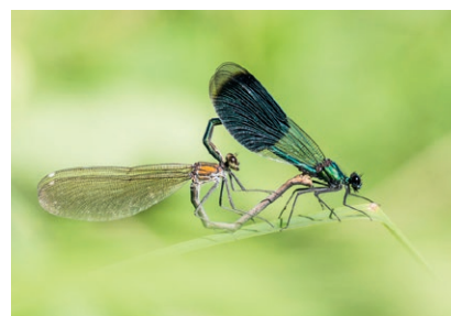
Accouplement de calopteryx

> Micro-aquarium. Comment fabriquer un micro-aquarium adapté à la prise de vue. Reconstitution du milieu naturel aquatique et photographies au flash de larves d'insectes ou d'alevins par les stagiaires.