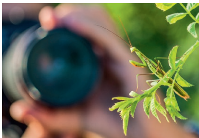
Approche d'une mante religieuse

> Après-midi consacrée à la prise de vue : flore et entomofaune très riches du Parc naturel régional de la Brenne : libellules, papillons, sauterelles, criquets, araignées, etc.