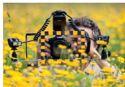
Macrophotographie d'insectes en vol

> La macro au grand-angle, au téléobjectif, ou bagues allonges : gestion des fonds et des premiers plans, etc.