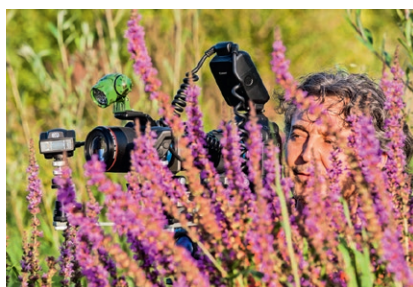
Macrophotographie au flash