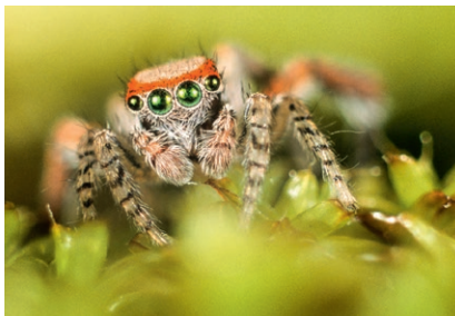
Araignée saltique à l'affût

Rendez-vous à l'Auberge « Les 2 pierres » : 8, place de l'église - 36800 Migné Téléphone : 02 54 38 39 89