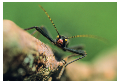
Atelier insectes : photo de phasme réalisée pendant le stage (phasme d'élevage prêté par le Muséum d'histoire naturelle de Tours).