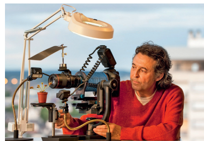
Atelier soufflet : photographies de plantes carnivores avec le soufflet et les flashes.

La fin de matinée sera consacrée au Focus stacking (prises de vue et assemblage des photographies avec le logiciel Helicon Focus). À cette occasion, Gilles Martin vous présentera le statif qu'il a spécialement conçu pour cette technique.